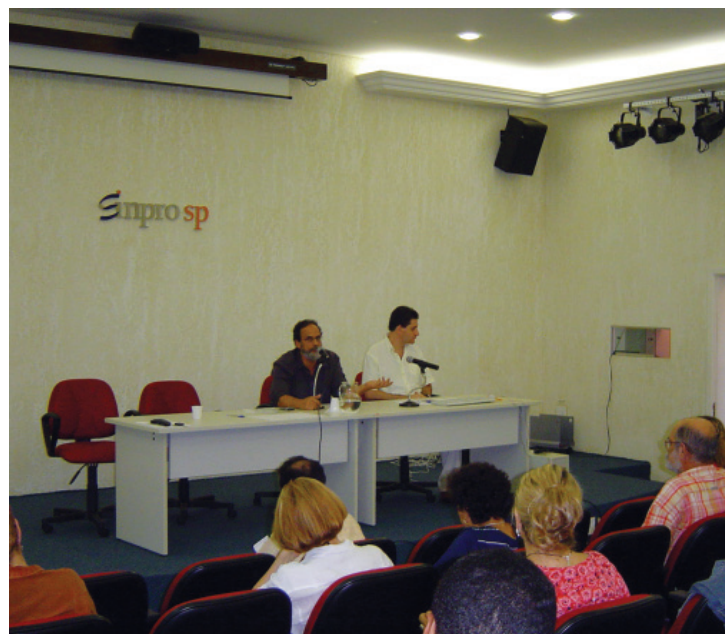
Professores reunidos em assembléia, no dia 15 de abril

O acordo aprovado restringe-se apenas à questão econômica, já que as demais cláusulas da convenção coletiva estão em pleno vigor com validade até 28 de fevereiro de 2005.